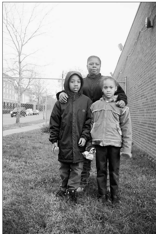
Raus aus der Stadt: Diese Familie musste für Büros Platz machen

Um die zweihundertfünfzig Familien haben den Kampf nicht aufgege-