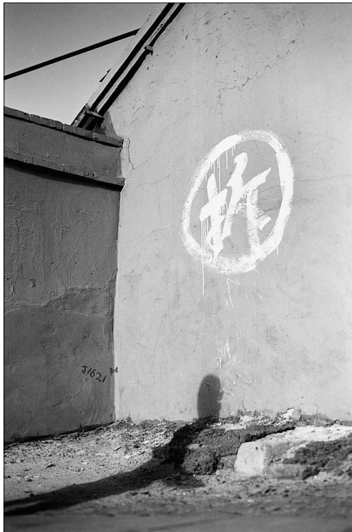
„Abreißen“ steht auf diesem Haus in einem Peking Hutong